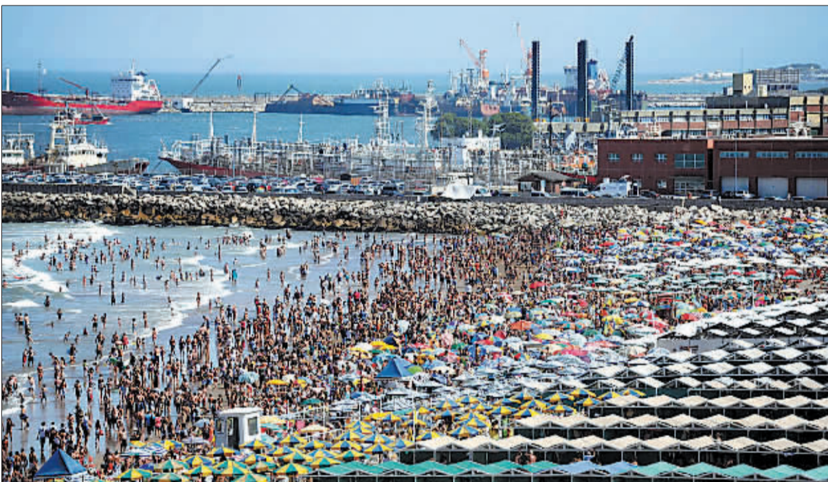
阿根廷海滨 迎来度假高峰

1月15日，大批游客在阿根廷海滨城市马德普拉塔的海滩上度假。阿根廷目前进入度假高峰。由于阿根廷货币持续贬值，吸引了巴西、乌拉圭和智利等邻近国家的游客前来阿根廷度假。