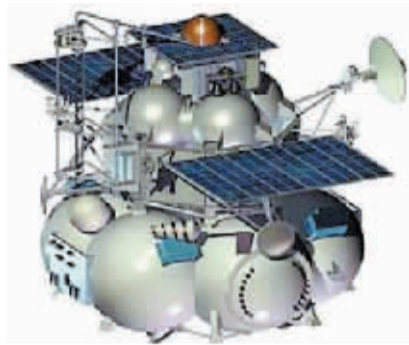
“福布斯-土壤”号火星探测器。 (据新华网)

往火星卫星“福布斯”，采回土壤样本。然而，探测器因主发动机未能启动，无法实现变轨，一度在近地轨道“转悠”。俄罗斯由于失去对“福布斯-土壤”号的有效控制，先前一直无法确定其坠落的具体时间和地点。格林尼治时间15日14时30分(北京时间15日22时30分)，俄罗斯航天局说，“福布斯-土壤”号运行轨道远地点距地球仅143公里，其绕地一圈所需时间缩短至87分钟。空天防御兵发言人佐洛图欣告诉国际文传电讯社：“空天防御兵任务控制处所获信息显示，‘福布斯-土壤’号残片将于格林尼治时间15日17时45分(北京时间16日1时45分)落入太平洋。”按佐洛图欣的说法，残片坠落海域位于智利南部岛屿惠灵顿岛以西1250公里。