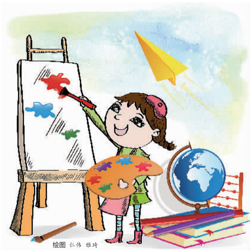
绘图 仁伟 雅琦

需要提醒的是,水平不拔尖的考生一定要知道,在报考的时候是大学选考生,而不是考生选大学。如果把报考理想都放在北京、上海、南京、杭州、广州等大城市的名牌大学,失望可能就会大得多。建议尽量在东北、西北和西南选择一些大学进行考试,道理很简单,都