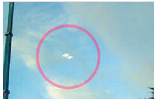
在肯特郡拍摄到的 UFO 照片。