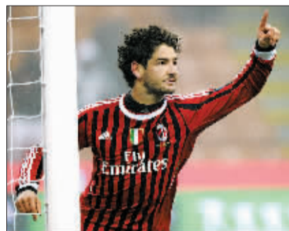
AC米兰队球员帕托庆祝进球。