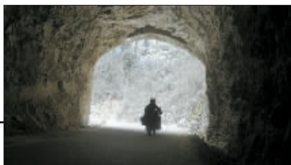
穿过这个涵洞，雪花忽然扑面而来。