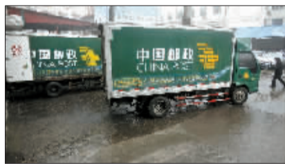
邮件先由大车运往县城。