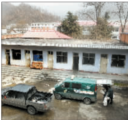
分拣后的邮件被面包车运到镇上。