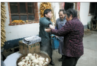
“来，尝尝俺做的糖馍。”