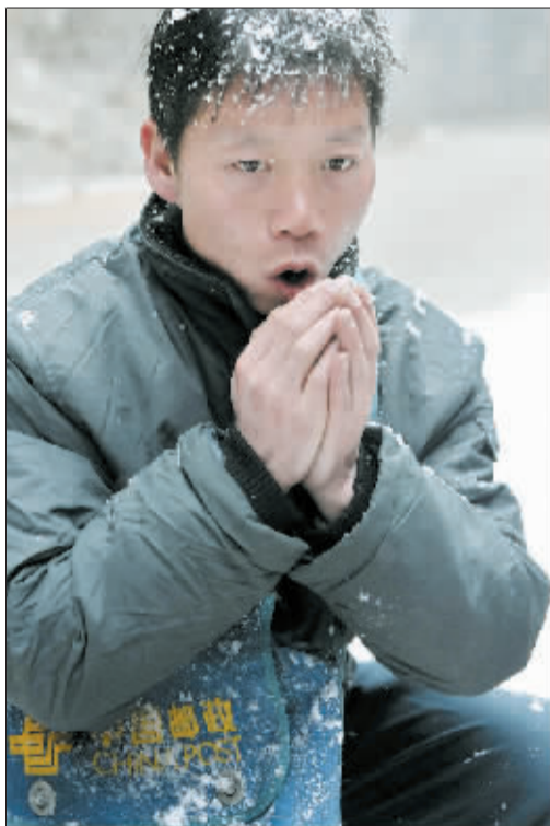
哈一口热气暖暖手。