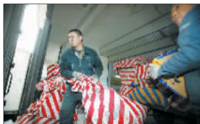
春节前，邮件投递量大增。