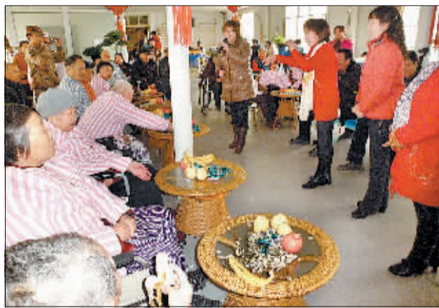
正月初七，艺术团唱着豫剧给养老院老人们拜年。