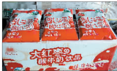
袋子上是“草莓”,箱子上是“大红枣”。

随后,记者又联系上市工商局消费者权益保护科,该科工作人员表示,由于该奶在送礼过程中经过多个环节,且消费者没有票据,又无法确定经销商,因此在维权方面有一定困难。该工作人员建议消费者查清经销商(即买奶地点)后,由工商部门进一步调查;或将奶送到质量监督管理部门检验检疫后,若确有质量问题,工商部门将对其依法查处。