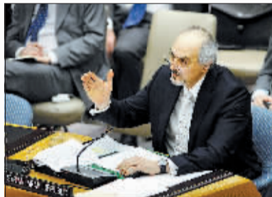
叙利亚常驻联合国代表贾法里在安理会会议上发言。

俄罗斯外长拉夫罗夫称,有些国家对中东地区的政权更迭很“痴迷”,如果这种偏执的情绪不消失,那就会看到比叙利亚、利比亚或埃及任何一个国家更为糟糕的情况。他还指出,俄罗斯从未坚持说阿萨德不能下台,但这要由叙利亚人民决定。