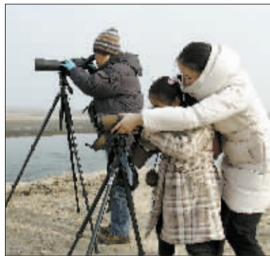
市民在孟津黄河湿地观鸟。

昨日,是第16个世界湿地日,河南黄河湿地国家级自然保护区洛阳管理处开展了包括观鸟在内的一系列系列活动。