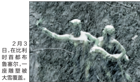
2月3日,在比利时首都布鲁塞尔,一座雕塑被大雪覆盖。