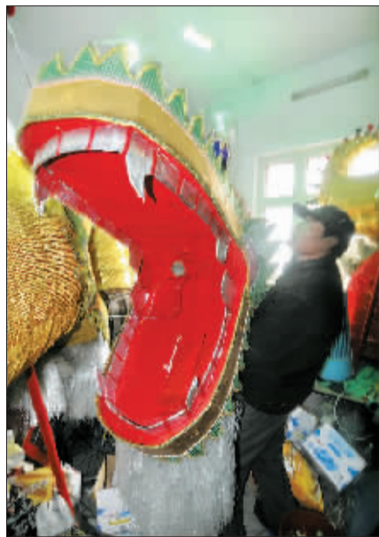
大张的龙口里暗藏玄机。