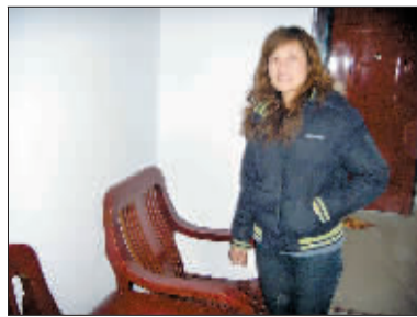
空荡荡的屋里多了家具。