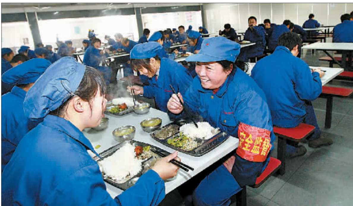
2月7日,在上海华新合金有限公司上班的外来务工者在公司食堂享用免费午餐,免费午餐已成为不少企业吸引外来务工者的重要手段之一。

今年“新工荒”的显著特点是:企业利润普遍下滑,而务工者要求收入刚性增长;东部地区企业的转型升级尚在进行,而中西部的产业转移初见成效,发展差距的缩小使得两者之间出现激烈的“抢人”大战。待遇不高招不到人,环境不好随时走人。务工者开始“用脚投票”,倒逼我国制造业加速转型升级。