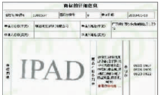
注册信息显示,深圳唯冠公司在二〇〇一年已拥有“iPad”商标。