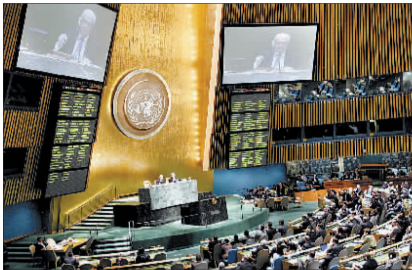
2月16日,在纽约联合国总部,联合国大会投票通过决议。

根据现场宣布的表决结果,有137个国家对这份由阿拉伯国家起草的决议投了赞成票,12个国家投票反对,17个国家弃权。