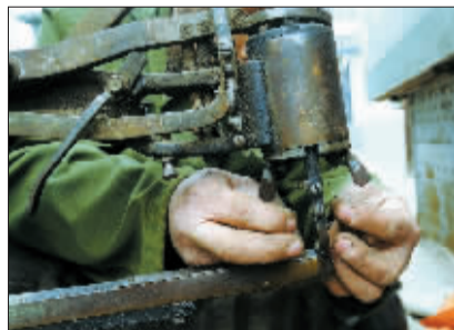
这双年轻的手是如此粗糙。