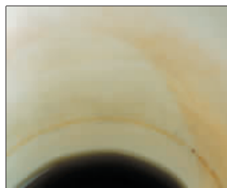
可乐浸泡后的杯子