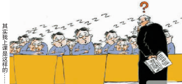
其实我上课是这样的……