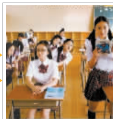
我老婆认为我上课是这样的……