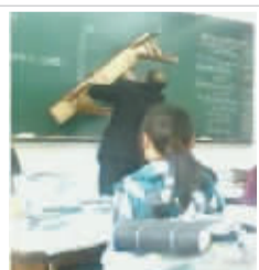
我朋友认为我上课是这样的……