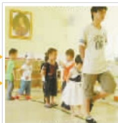
我同事认为我上课是这样的……