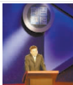
我父母认为我上课是这样的……