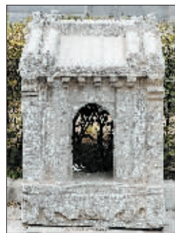
从民间搜集到的香炉