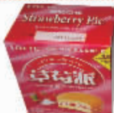
乐天卡布奇诺蛋黄派 编码:033175 会员价:3.5元/盒