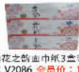
120抽花之韵面巾纸3盒装 编码:V2086 会员价:12.5元/盒