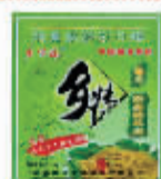
乡下妹精品榨菜丝138g 编码:033863 会员价:1.05元/包