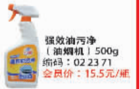
强效油污净 (油烟机)500g 编码:022371 会员价:15.5元/瓶