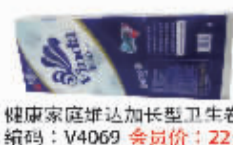
健康家庭维达加长型卫生卷纸 编码:V4069 会员价:22元/提