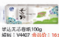
维达无芯卷纸100g 编码:V4407 会员价:16元/提