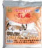
绿源石磨面高筋粉5kg 编码:033063 会员价:24元/袋