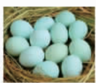
绿壳土鸡蛋散装 会员价:14.8元/斤

购物满20元,送价值2.3元白猫280g洗衣粉一袋 购物满50元,送价值100元王莽岭景区门票一张 活动时间:3月7日至11日 活动名额:各100名