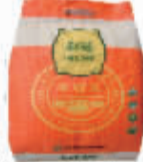
利是东北大米5kg 编码:033066 会员价:34.5元/袋