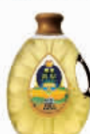
西王玉米 鲜胚芽油3L 会员价:96元