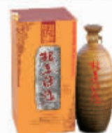
杜康粮在河洛酒 500ml 会员价:168元