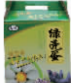
绿壳土鸡蛋礼盒装 会员价:108元/盒