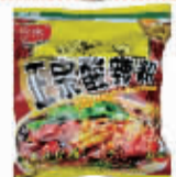
白家袋装酸辣粉108g 编码:033172 会员价:3.3元/碗