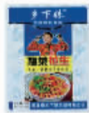
乡下妹梅菜花生75g 编码:033868 会员价:1.60元/包