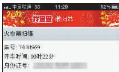
加密前的扫描结果