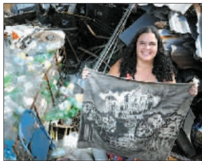
埃尔西利亚用垃圾堆里捡到的书本进行自学,考进了巴西名牌大学。(据中国日报网)