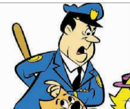
英国首相卡梅伦和《猫老大》主角迪布尔警官。

英国民众总是爱拿政治人物开玩笑。据该国媒体3月5日报道,日前有网友发现,包括英国首相卡梅伦、前首相布莱尔、外长黑格、工党领袖埃德·米利班德和住房与社区大臣皮克尔斯等在内的多位政坛高官竟跟知名卡通角色“撞脸”,不仅五官有异曲同工之处,表情更是非常相似,让人看了忍俊不禁。(据中国日报网)