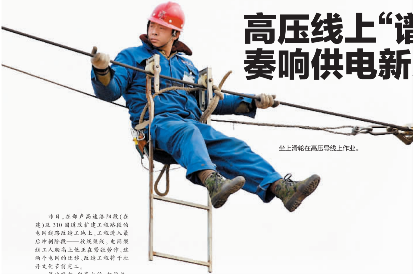
坐上滑轮在高压导线上作业。

昨日,在郑卢高速洛阳段(在建)及310国道改扩建工程路段的电网线路改造工地上,工程进入最后冲刺阶段——放线架线。电网架线工人爬高上低正在紧张劳作,这两个电网的迁移、改造工程将于牡丹文化节前完工。