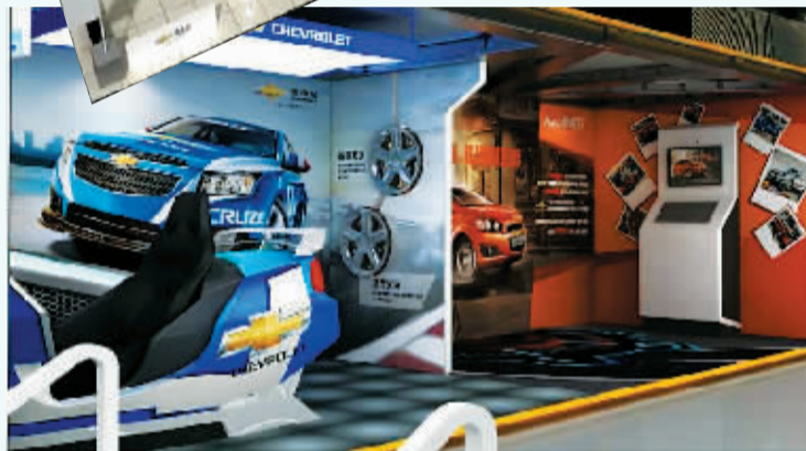
汽车公园实景图(资料图片)