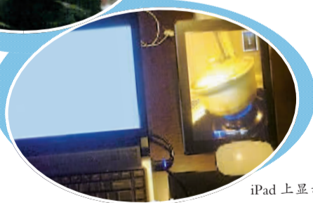
iPad上显示汤锅的状态。

也许远程喂食有点儿难度，但远程监控却丝毫没有门槛，网上疯传的“iPhone炖汤法”或许能满足一部分“远程控”的心愿。