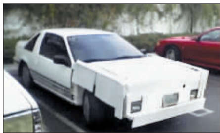
硬纸板打造引擎盖。