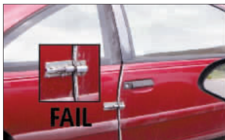
插销安装在车门上。