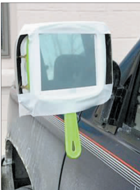
梳妆镜当后视镜。