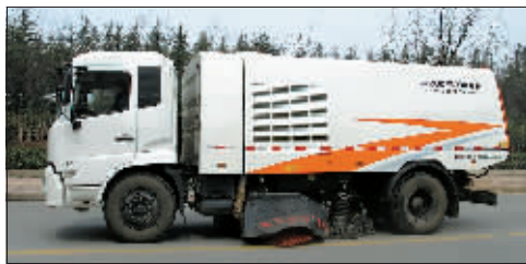
这就是“特种兵”中的干式机扫车。(资料图片)

这个工程量可不算小。不过别担心,我市环卫部门将加派“特种兵”,增加一批机械化环卫作业设施,城市区环卫作业机械化率将超过 50%。