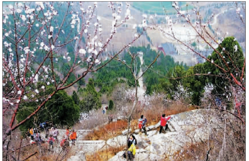
驴友“云航电子”拍摄的春景图。

如果您是骑行爱好者的话，也可选个晴好的天气骑自行车前往，路程不远，而且风景优美，适合放风筝、踏青。