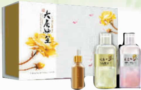
大唐女皇养颜 牡丹护肤精华(套装)

产品简介:该系列产品精选洛阳特色国花牡丹为原料,通过现代技术提取其营养护肤精华成分,让你看得见花瓣,闻得到花香,在享受牡丹精华水深层滋润的同时,感受牡丹真花瓣的视觉美妙体验。