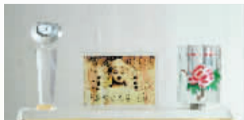
办公工艺礼品 价格:205元