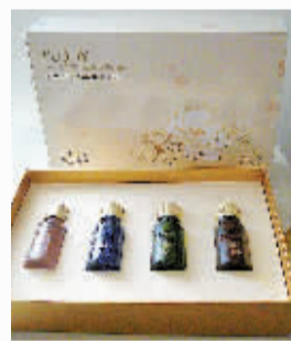
国色牡丹芳香精油 奢华礼品四件套