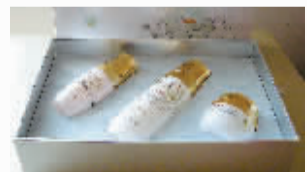
国色牡丹臻白 奢华护肤系列 价格:580元

免费送货上门,让购物更方便! 人多力量大,团购更优惠! 订购电话:66778866