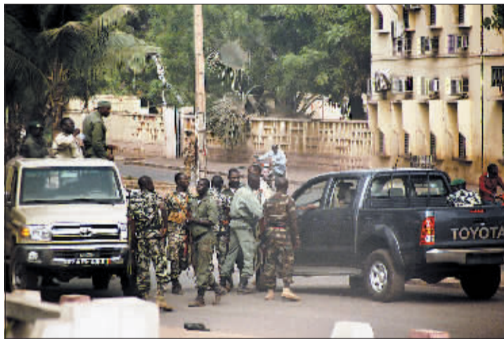
3月21日,马里士兵聚集在首都巴马科街头。