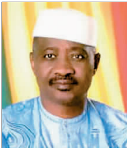
马里总统杜尔