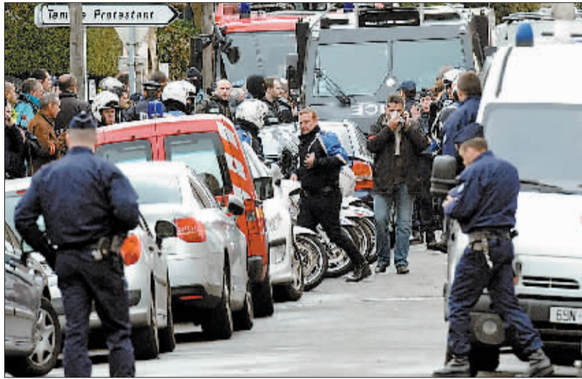
3月22日,警察在梅拉赫藏匿的住宅楼周围发动围捕行动。

本月 19 日,一名枪手在法国南部城市图卢兹一所犹太学校门前开枪打死 3 名学生和 1 名教师,震惊法国社会。11 日和 15 日,还有 4 名军人分别在图卢兹和蒙特邦市遭到枪击,其中 3 人死亡,1 人重伤。警方