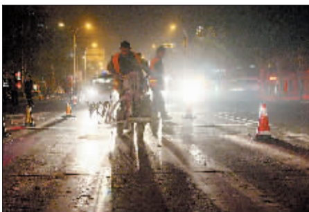
昨夜,市交管支队设施大队连夜在九都路丽新路口改造路段喷画交通标线。