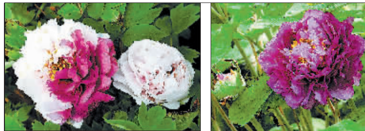
隋唐城遗址植物园内,一些心急的牡丹花已经开放了。