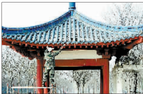
重新粉刷,让亭子更漂亮。