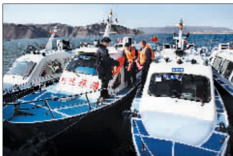
市地方海事局对200多艘客船进行全面安检。