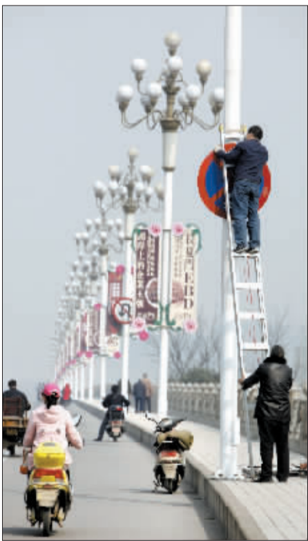
王城大桥上,工人正在更新牡丹文化节公益广告。

牡丹观赏园内,工人们在粉刷亭台楼阁,铺设游园道路,雕刻牡丹诗词等;市区道路边,工人们更换牡丹文化节公益广告、灯泡,铺设草坪等;连日来,市地方海事局对辖区内黄河小浪底水域、陆浑水库、故县水库拟投入牡丹文化节的200多艘客船进行全面安全检查;就连赋闲在家的老人,也拿起剪刀,剪两幅牡丹剪纸作品,为牡丹文化节献礼。