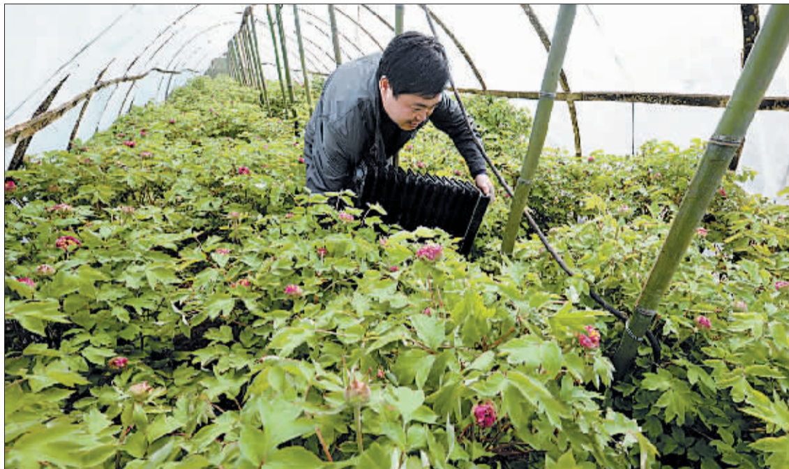
用电暖器给牡丹增温。