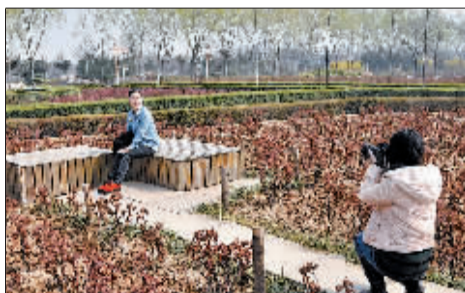
隋唐城遗址植物园为游客打造摄影平台。