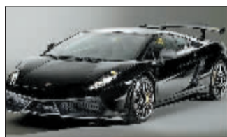
兰博基尼也玩腻了。