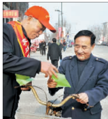
昨日,一群头戴小红帽的老年“交通安全管理志愿者”出现在孟津县城的桂花大道各大路口,向路人散发道路交通安全宣传单,劝阻交通违法行为。这些志愿者最小的也已年过六旬,为迎接牡丹文化节,他们自发组织起来,以“文明倡导、温馨提醒、善意劝阻”的形式参与到道路交通安全管理中。