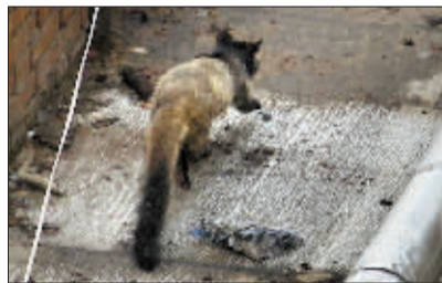
图①：嘘，它露出了头！ 图②：嗨，它飞檐走壁！ 图③：嘿，它很从容！