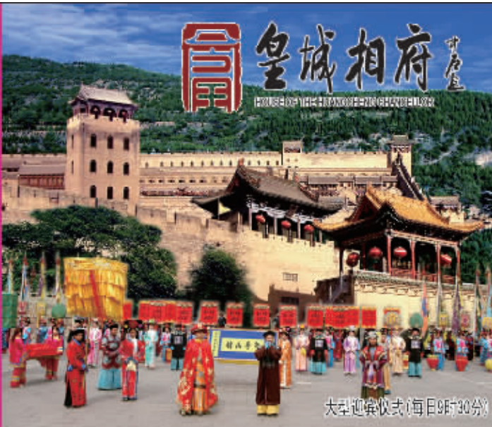
大型迎宾仪式(每日9时30分)