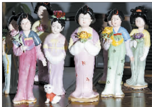
牡丹瓷唐韵仕女