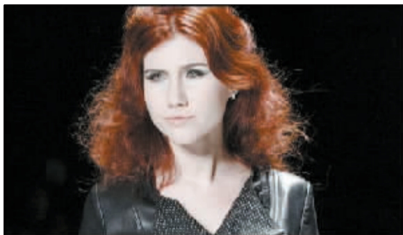
↑俄罗斯美女间谍查普曼 (资料图片) ←俄罗斯间谍墨菲 (资料图片)