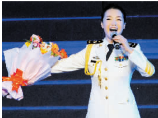
烟花晚会上,文艺节目也精彩。