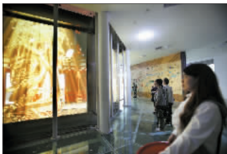
在电解质调光玻璃上播放影像