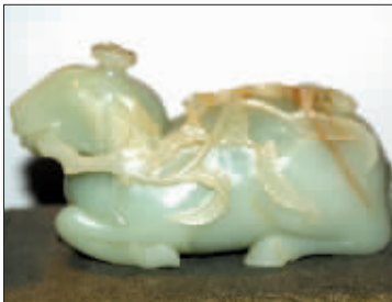
以上是兀军平的部分藏品。