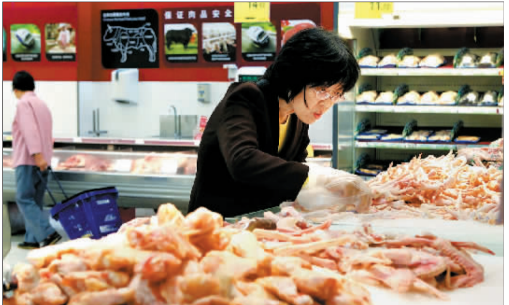
消费者在上海一家大型超市内选购肉禽制品。

与此同时,随着季节的转换,蔬菜供给大量增加。交通银行研究员唐建伟认为,蔬菜价格会随天气好转而回落,全年物价整体下行趋势将不会改变。