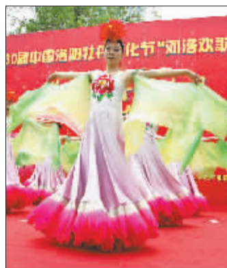
见习记者 程芳菲 记者 李燕锋/文