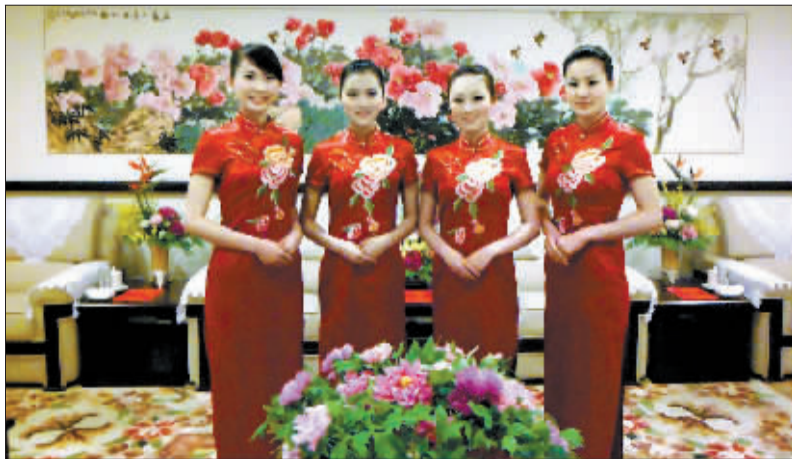
姑娘们在开幕式结束后合影。(由采访对象提供)