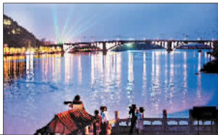
龙门石窟亮化提升后的龙门大桥