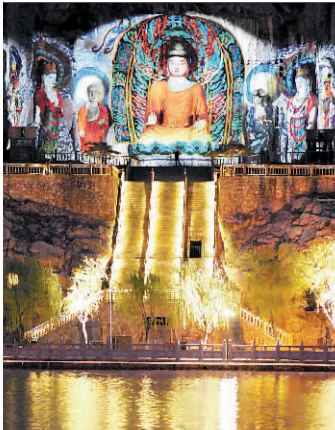
龙门石窟奉先寺夜景