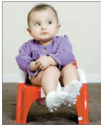
奥尼丘克解手时坐姿优雅。