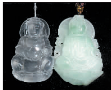
左为天然A货，右为B货。