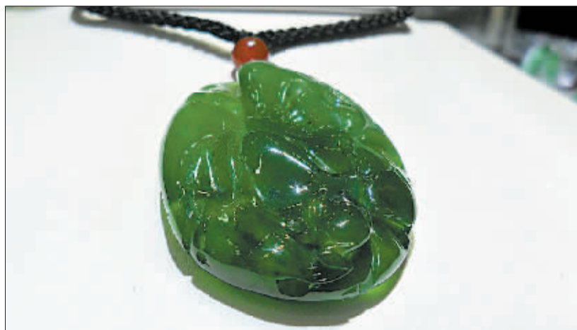
价值千万元的帝王绿翡翠

阳光明媚的春天，将一件翡翠萦于玉颈或皓腕，不仅增添了生机勃勃的翠色，令人心旷神怡，更在端庄娴静中透出一分清雅。不少人想买翡翠扮靓，但因为不懂识别，屡屡发生买到低档货的烦心事。对此，记者请来珠宝鉴定师，为您挑选翡翠支招。