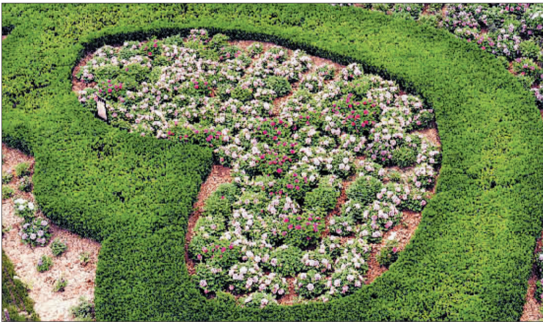
聆听花语，默许心愿。 (隋唐城遗址植物园)