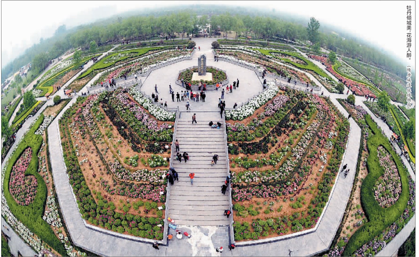
牡丹倾城美，花海游人醉。 (隋唐城遗址植物园)