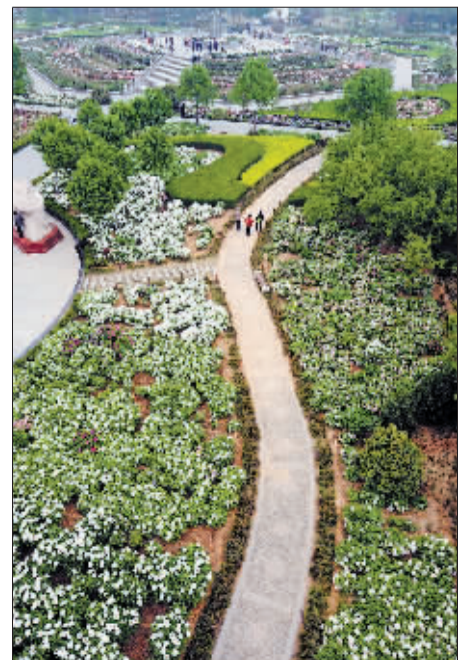
何人不爱牡丹花，占断城中好物华。 (隋唐城遗址植物园)