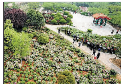
共享春之韵，同赏国色美。 (中国国花园)