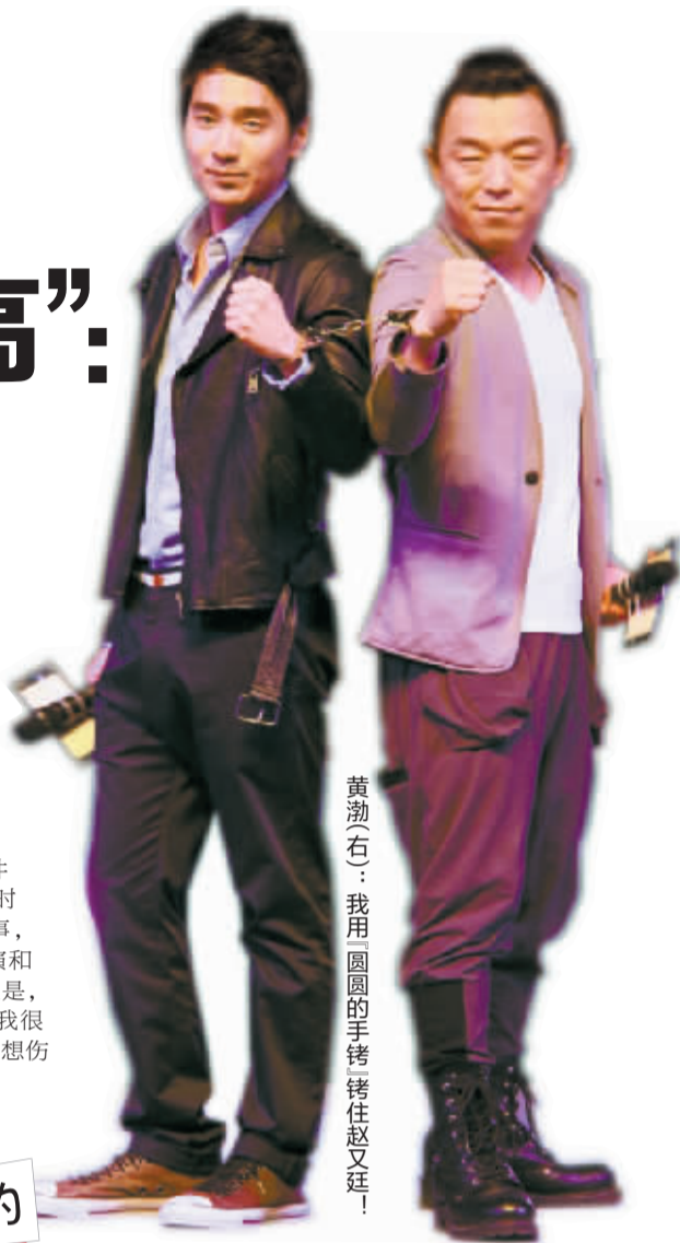
黄渤(右)：我用「圆圆的手铐」铐住赵又廷！

此前被爆料与比自己大5岁的高圆圆相恋，有媒体称赵又廷不“恐高”，他在现场表示：“现在讨论这件事情还不是适合的时机，我不想炒作这件事，不想对不起陈凯歌导演和蔡岳勋导演。我的回应是，圆圆是非常好的女人，我很珍惜她，想保护她，不想伤害她。”