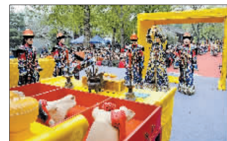
4月19日,北海公园先蚕坛重现清代皇后亲蚕躬桑典礼。亲蚕躬桑之礼是古代皇家各类祭祀活动中少有的由皇后、嫔妃、公主参与的国家典礼,祭祀的先蚕神西陵氏相传是黄帝的元妃。图为“皇后”向先蚕神敬酒。