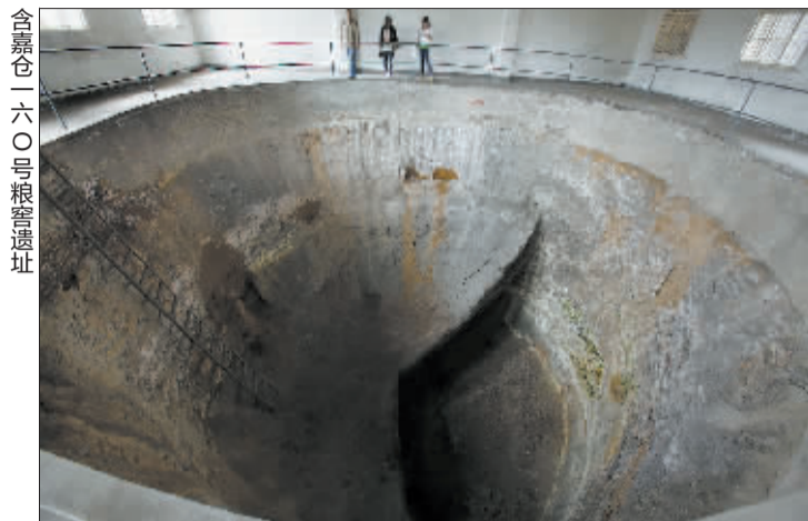
含嘉仓一六〇号粮窖遗址