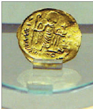
▲安菩墓里的罗马金币